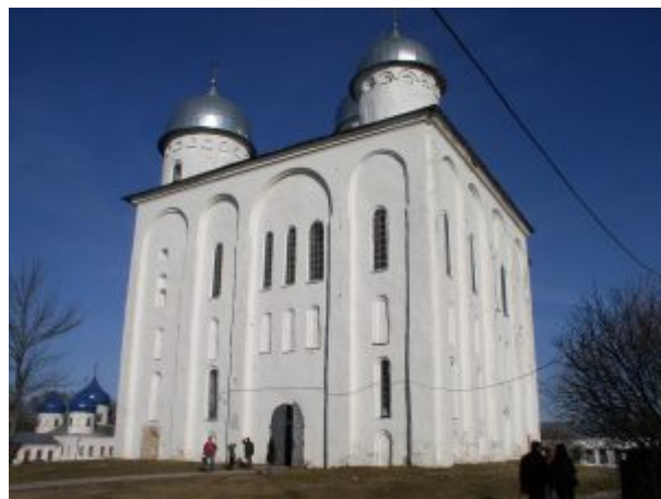
Георгиевский собор Юрьева монастыря

1119 — Следующая постройка князя Мстислава - это одно из самых главных сооружений в