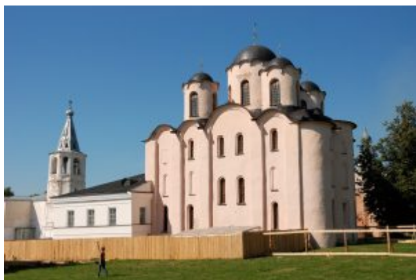
Великий Новгород, собор Николая Чудотворца на Ярославовом дворе.

Святая София для новгородцев станет символом их города, их независимости, их самостоятельности. Эти люди очень особенно воспринимали все свои храмы, все свои святыни. София Новгородская простояла не расписанной 50 лет. Фрески много разрушались, храм много страдал. Отношение новгородцев к своим святыням проявилось в легенде о фреске Христа Пантократора: Христос был изображен на фреске с благословляющим жестом, но он был более закрыт, чем открыт. И говорили, что живописцы сначала хотели написать спаса с открытой рукой, но на следующий день после написания рука снова сжималась, они исправляли, а на следующий день рука снова сжималась. В итоге, сам образ обратился к живописцам: «Не пишите меня с открытой рукой, пишите меня с закрытой рукой, пока она сжата, стоит господин Великий Новгород».