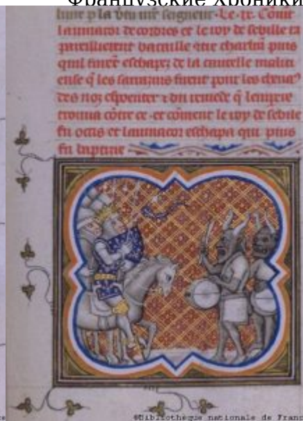
Сарацины, переодетые дьяволами