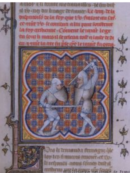
Битва Роланда и Феррагута