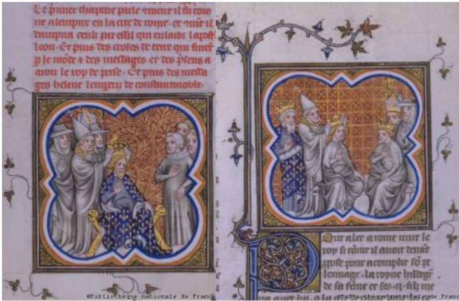
Коронация Карла Великого