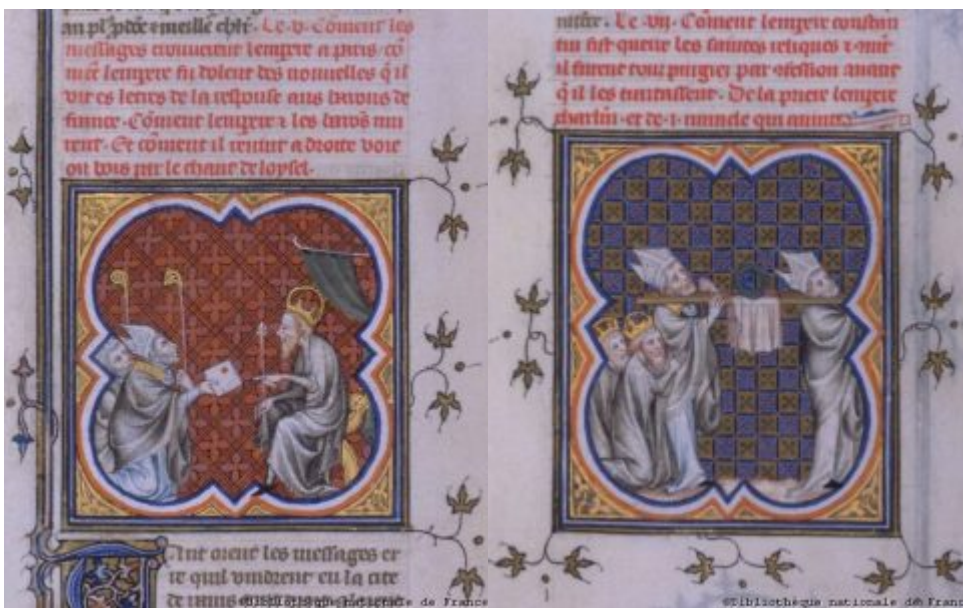
Карл принимает послов