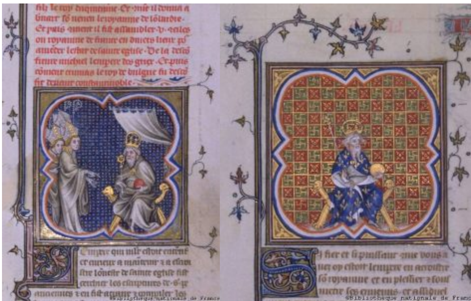
Карл и епископы

Бог, девяносто девять царств создавший, Над всеми ними Францию поставил, Дал в короли Великого ей Карла, А тот ее покрыл нетленной славой. Нет стран на свете, Карлу неподвластных. Он покорил и немцев, и баварцев, Бретонцев, и анжуйцев, и нормандцев, Наваррцев, и тосканцев, и ломбардцев.