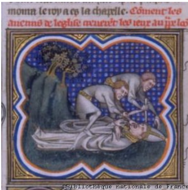
Пытка Льва III