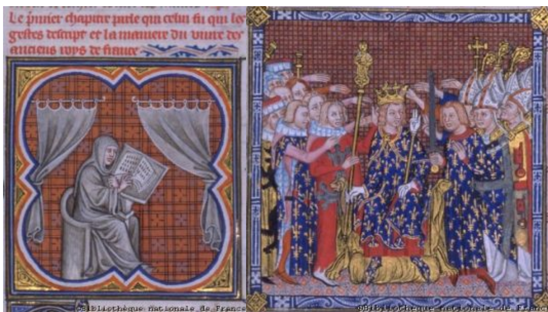
Эйнхард, пишущий «Жизнь Карла Великого»