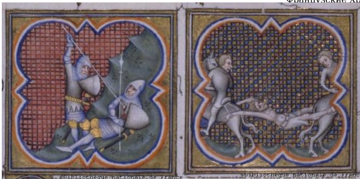
Битва Ганелона и Тьерри д'Ардана