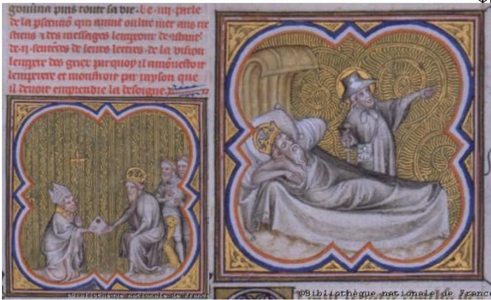
Карл получает Сен-Клу