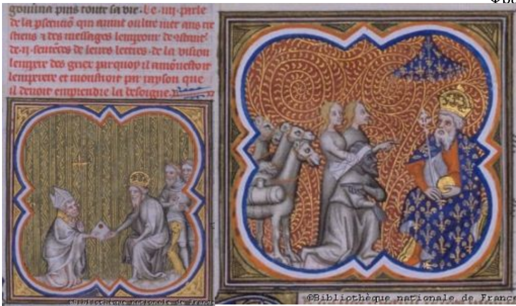
Константин VI и посланцы