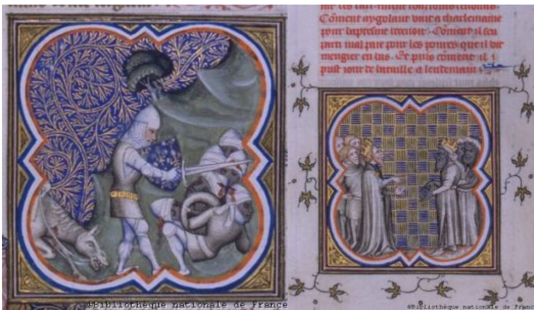
Карл убивает сарацинов