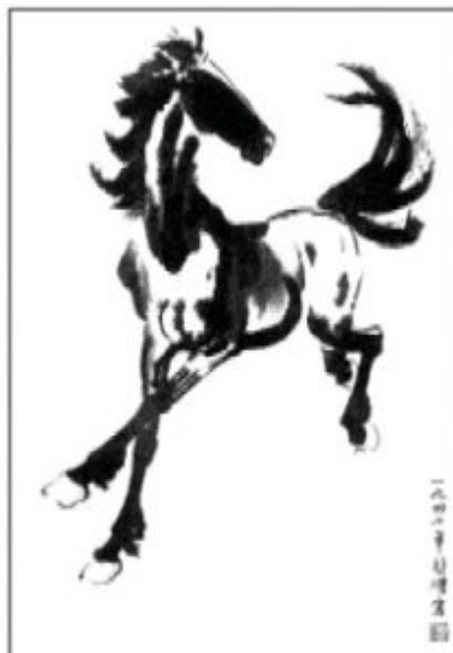
Сюй Бэй-хун. Быстро скачущая лошадь. Тушь,