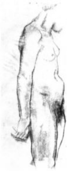
К.Кольвиц. Обнаженная. Уголь, 1904.

Особым качеством обладает перьевой рисунок. Работает художник разбавленной тушью или специальными чернилами,