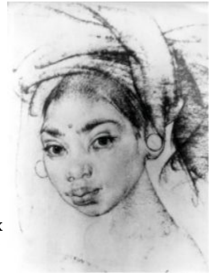
Фешин. Портрет. Уголь.

Широко распространен в графике прием рисования жидкими черными материалами (чаще всего тушью) при помощи кистей, так называемого фетрового пера или заточенных деревянных палочек. Этот прием отличается очень разнообразным, свободным и темпераментным сочетанием штрихов одного глубокого черного тона.