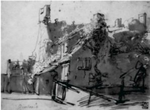
Рембрандт. Пейзаж. Бистр, перо, кисть, 1630.