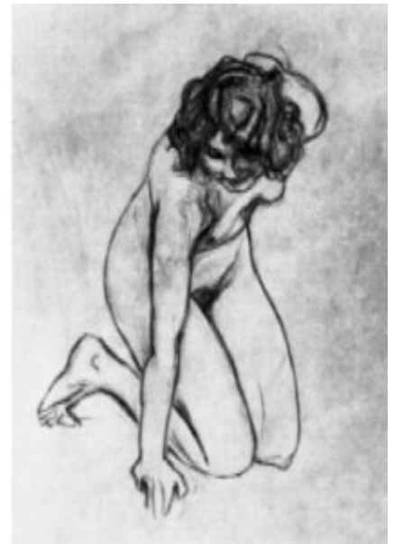
В.Серов. Подготовительный рисунок к картине «Похищение Европы». 1910.

Особую роль в структуре мира рисунка играет набросок. Набросок – специфически рисуночный тип художественного произведения. Он развит только в рисунке, и развит очень широко; особенности рисунка раскрываются в нём наиболее обнаженно, предстают в своем крайнем выражении.