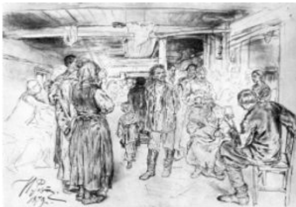
И.Е.Репин. Композиционный рисунок к картине «Арест пропагандиста». 1879.

создания «багажа» наблюдений, впечатлений, средством совершенствования мастерства; с помощью этюдов происходит художественное освоение самых разных элементов окружающего мира. Однако и для таких работ во многих случаях характерна типологическая неопределенность, невозможность отделить их от станковых рисунков.