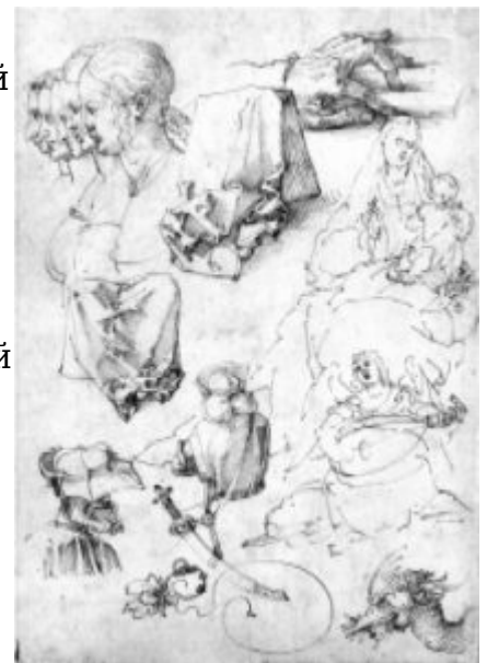
А.Дюрер. Рисунок. Перо, бистр, 1511.

Микеланджело Буонаротти исполнил целый ряд рисунков на темы античных мифов «Падение Фаэтона», «Ганимед», «Наказание Тития», А.Альтдорфер и Х.Грин – многочисленные листы на религиозные и мифологические сюжеты, венецианские и нидерландские художники