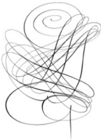
Каллиграфический рисунок. П.Семченко. Роза. Тушь, перо, 1992.

персонаж картины или фрески, и натура, которая служит моделью для этого персонажа. Соотношение этих «составляющих» в конкретных рисунках различно, что создаёт неоднородность рисунков внутри каждого типа.