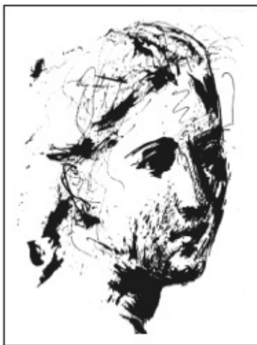
Пикассо. Голова женщины. Тушь, перо, 1924.