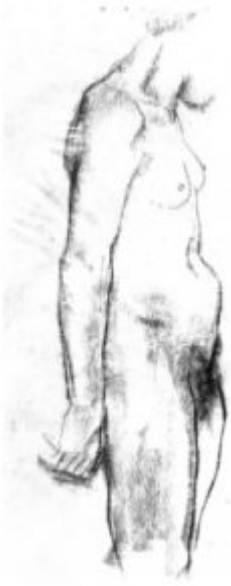
К.Кольвиц. Обнаженная. Уголь, 1904.

Особым качеством обладает перьевой рисунок. Работает художник разбавленной тушью или специальными чернилами,