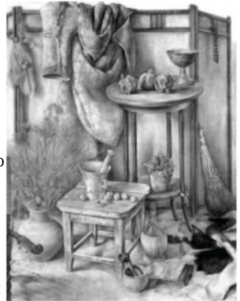
Станковый рисунок. Р.Хачатрян. Натюрморт. Левкас, сепия, 1982.

контуром и моделировкой объёма; при втором - контуры и сама форма словно бы растворяются, расплавляются в окружающем воздушном пространстве. Живописный, или тональный, рисунок (так как в нём большую, а часто и основную роль играют пятна того или иного тона) характерен в основном для венецианских художников - Джорджоне, Тициана, Тинторетто; в нём достигается передача воздушной среды, вибрации света, динамики форм. Использование сангины, сочетание нескольких техник, применение грунтованной бумаги различных цветов, на которой рисовали чёрным тоном и белилами, создали в рисунке свою полихромную, свои проблемы цвета и тона, свою колористическую