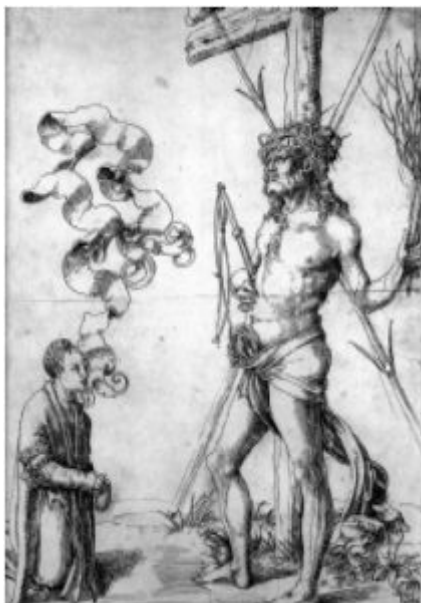
Х.Грин. Рисунок.Перо, бистр, 1503.

«Собственно» рисунок сложился совсем недавно по сравнению с рисунком, понимаемым как всякое изображение линиями (который и является самым древним, самым первым способом изображения).