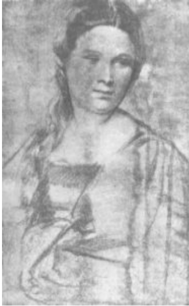
Тициан. Женский портрет. Уголь.

создавали пейзажи, отличающиеся масштабностью, разработанной композицией, завершённостью исполнения.