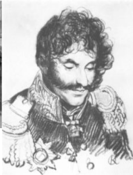
О.Кипренский. Портрет Е.Чаплица. Итальянский карандаш, 1813.