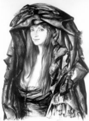
Р.Хачатрян. Портрет. Картон, сепия, 1978.

Рисунки выполняются не только в какой-нибудь одной технике. Очень часто графики в одной работе сочетают две, три и даже большее