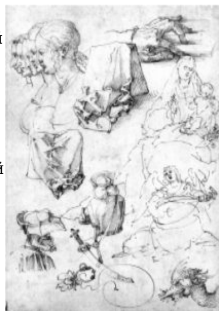
А.Дюрер. Рисунок. Перо, бистр, 1511.

Микеланджело Буонаротти исполнил целый ряд рисунков на темы античных мифов «Падение Фаэтона», «Ганимед», «Наказание Тития», А.Альтдорфер и Х.Грин – многочисленные листы на религиозные и мифологические сюжеты, венецианские и нидерландские художники