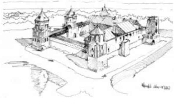
Пример самостоятельного этюда. А.Филипович. Мирский замок. Учебная работа. Тушь, перо, 1996.

Среди самостоятельных работ, помимо станковых и свободных рисунков, принято выделять такой тип произведений, как самостоятельные этюды . Они служат средством изучения окружающего мира в различных его проявлениях,