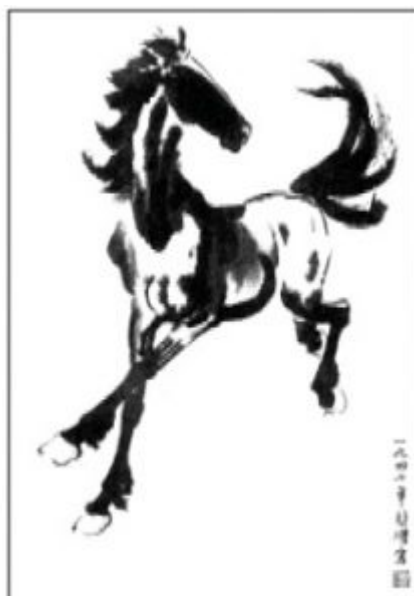
Сюй Бэй-хун. Быстро скачущая лошадь. Тушь,