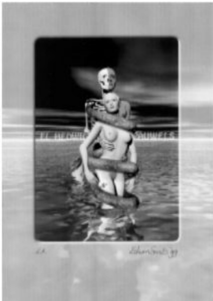
Э.Смидс. Экслибрис. Компьютерная графика, 1999

Итак, основные особенности искусства графики сводятся к следующему: графика – такой вид изобразительного искусства, основу которого составляет рисунок; главными изобразительными средствами графики являются линия, штрих, пятно, фактура, светотень; цвет в графике применяется более