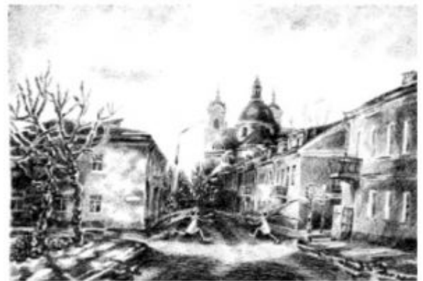
А.Дорошенко. Лист из серии «Гений места». Дипломная работа. Тушь, перо, 1999.

Возможности эмоционального воздействия цвета, его свойства использует и графика. Но в силу особых задач графического искусства и своеобразия графических материалов, цветовые решения в графике существенно отличаются от цветового решения в живописи. При работе черным материалом на белой бумаге различают массу