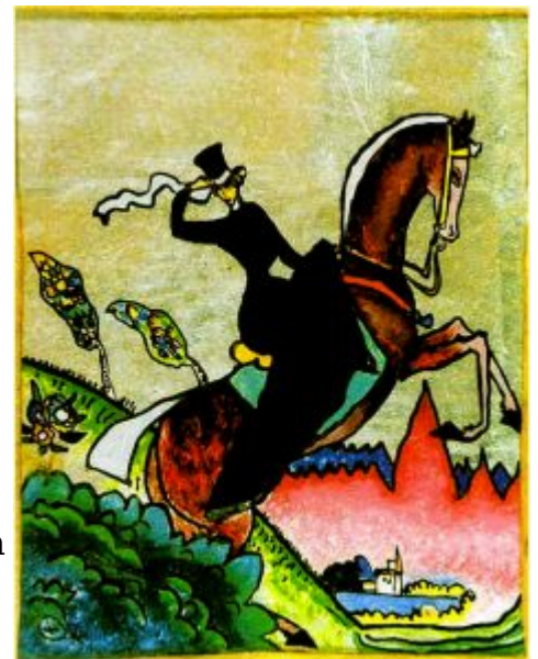
В. Кандинский. «Амазонка». 1911. Азербайджанский музей искусств, Баку

Художники высказывались об особенностях современного искусства: важной роли цвета, отказе от попыток подражания реальным формам. Они анализировали совершенно разные произведения искусства, от средневековой готики вплоть до лубка, подтверждая их скрытое родство в поисках выразительности. Именно тогда впервые в ранг высокого искусства были возведены детские рисунки.