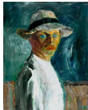
Автопортрет Эмиля Нольде

Август Маке и Франц Марк придерживались мнения, что у каждого человека есть внутреннее и внешнее восприятие действительности, которые следует объединить посредством искусства. Эта идея была обоснована теоретически Кандинским. Группа стремилась достичь равноправия всех форм искусства.