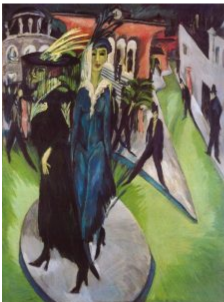
«Потсдамская площадь в Берлине». 1914 Эрнст Людвиг Кирхнер

С 1906 г. «Мост» ежегодно издавал так называемые папки, каждая из которых воспроизводила работы одного из членов группы.