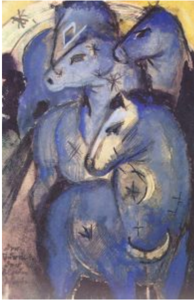
Франц Марк. Башня синих коней (1913)

Экспрессионизм. Деятельность художественной группы «Мост» и объединения «Синий всадник» | 4