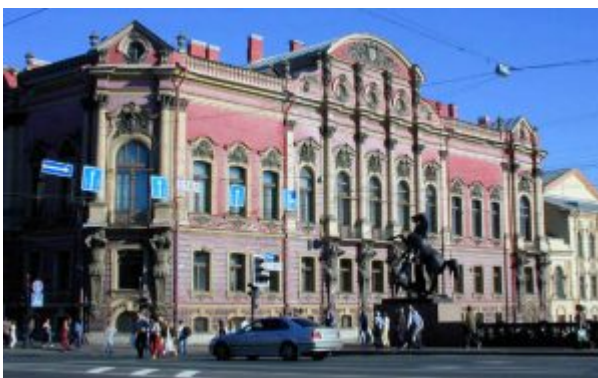
Ранняя эклектика А. И. Штакеншнейдера — частный дом-

Классицизм (от лат. classicus – образцовый), стиль и направление в литературе и искусстве XVII – начала XIX веков, обратившиеся к античному наследию как к норме и идеальному образцу. Классицизм сложился в XVII веке во Франции, отразив подъем абсолютизма. В XVIII веке классицизм был связан с буржуазным Просвещением и выразил гражданские идеалы, бурж.-рев. устремления. Классицизм, основывавшийся на идеях философии рационализма, на представлениях о разумной закономерности мира, о прекрасной облагороженной природе, стремился к выражению большого общественного содержания, возвышенных героических и нравственных идеалов (главные темы – конфликт общественных и личных начал, долга и чувства), к строгой организованности логичных, ясных и гармоничных образов. Вместе с тем классицизму были присущи черты утопизма, идеализации и отвлеченности, нараставшие в периоды его кризиса. Архитектуре классицизма (Ж. Ардуэн-Мансар, Ж. А. Габриель, К. Н. Леду во Франции, К. Рен в Англии, В.И. Баженов, М.Ф. Казаков, а. Н. Воронихин, А.Д. Захаров, К.И. Росси в России) присущи четкость и геометризм форм, логичность планировки, сочетание стены с ордером и сдержанным декором. К середине XIX века классицизм переродился в безжизненный академизм.