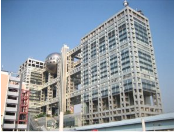
Штаб-квартира Fuji TV (арх. Кэндзо Тангэ)

Хайтек (хай-тек) (англ. high-tech — высокие технологии), художественное течение, возникшее в 70-80-е годы XX века. В его основе — максимальная функциональность. Никаких декоративных излишеств. Активное внедрение новейших технологий в среду обитания человека. Свет гармонично сочетается с пространством. Конструкциям присущи: строгость и простота, прямые линии, простые геометрические формы. Декор спокойный. В цветовой гамме преобладает однотонность. Много металла и стекла. В числе сооружений стиля «хайтек» («хай-тек»): Центр по борьбе с профессиональными заболеваниями в Колумбусе, Индиана, США, 1973; Детский музей в Бруклине, Нью-Йорк, США, 1977.