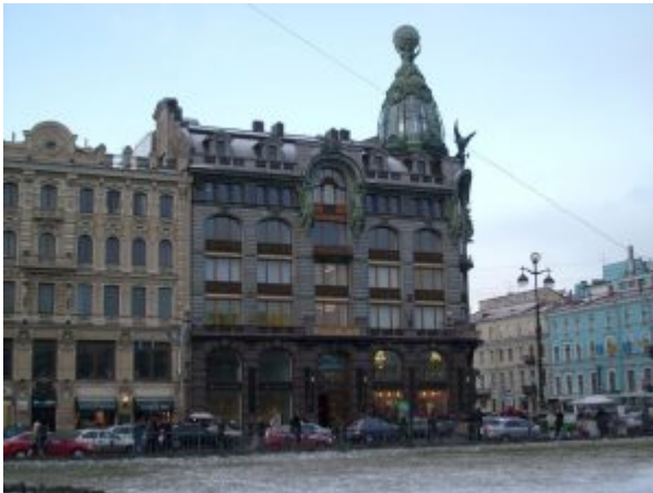
Дом компании «Зингер» (ныне — штаб-квартира компании Вконтакте) в Санкт-Петербурге.

Эклектика прошла два этапа в развитии — 1830-е—1860-е гг. и 1870-е—1890-е гг.; в России естественно разделение на «николаевский» и «александровский» этапы. За этим делением стоит не столько различие в политических режимах, сколько социальная эволюция общества России и Европы в целом, возникновение нового класса заказчиков и новых функций архитектуры.