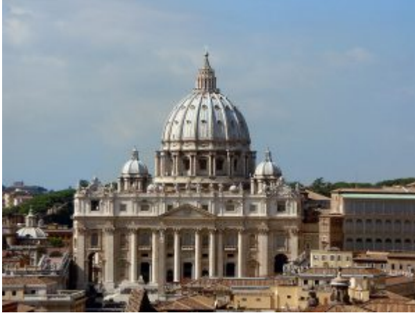
Собор святого Петра в Риме.

новыми устремлениями, лирическими эмоциями; расширяется интерес к реальному миру, природе, богатству переживаний. В XV – XVI веках готику сменяет возрождение.