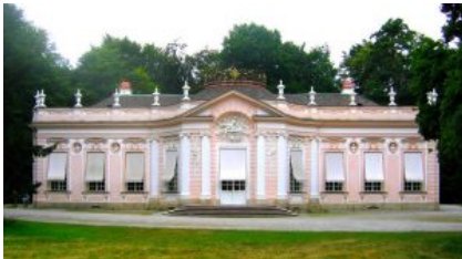
Французское рококо: Амалиенбург под Мюнхеном.

Барокко (итал. barocco – странный, причудливый) основное стилевое направление в искусстве Европы и Америки конца XVI – середины XVIII веков. Барокко, связанное с дворянско-церковной культурой зрелого абсолютизма, тяготеющее к торжествующему «большому стилю», в то же время отразило антифеодалные устремления, прогрессивные представления о сложности, многообразии, изменчивости мира. Барокко свойственны контрастность, напряженность, динамичность образов, аффектация, стремление к величию и пышности, к совмещению реальности и иллюзии, к слиянию искусств (городские и дворцовые парковые ансамбли, опера, оратория). Для архитектуры барокко (Л. Бернини, Ф. Борромини в Италии, В. В. Растрелли в России) характерны пространственный размах, слитность, текучесть сложных, обычно криволинейных форм. Разнообразны национальные варианты барокко (например, «московское», «нарышкинское» барокко в России).