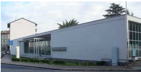
Комо — Приют Сант'Элиа. Джузеппе Терраньи

Конструктивисты видели своей задачей увеличение роли архитектуры в жизни, и способствовать этому должны были отрицание исторической преемственности, отказ от декоративных элементов классических стилей, использование функциональной схемы как основы пространственной композиции. Конструктивисты искали выразительность не в декоре, а в динамике простых конструкций, вертикалей и горизонталей строения, свободе плана здания.