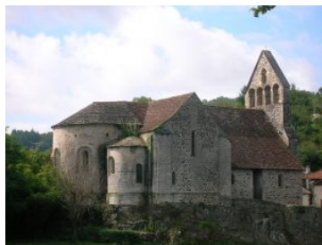
Капелла кающихся грешников. Больё-сюр-Дордонь.

Романский стиль. X- XII века (в некоторых странах XIII век) (с элементами римско-античной культуры). Средневековое западноевропейское искусство времени полного господства феодально-религиозной идеологии. Главная роль в романском стиле отводилась суровой, крепостного характера архитектуре: монастырские комплексы, церкви, замки располагались на возвышенных местах, господствуя над местностью. Церкви украшались росписями и рельефами, в условных, экспрессивных формах, выражавшими пугающее могущество божеств. Вместе с тем полусказочные сюжеты, изображения животных и растений восходили к народному творчеству. Высокого развития достигли обработка металла и дерева, эмаль, миниатюра. Для романской эпохи характерны благородство и строгая красота.