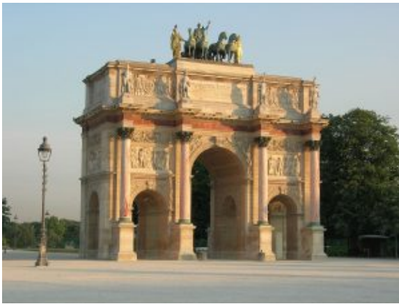
Арка Каррузель, Париж

формы иронии, гротеска, поэтику двоемирия. Интерес к национальному прошлому (нередко – его идеализация), традициям фольклора и культуре своего и других народов, стремление создать универсальную картину мира (прежде всего истории и литературы), идея синтеза искусств нашли выражение в идеологии и практике романтизма. Большинство национальных школ романтизма в изобразительном искусстве сложилось в борьбе с официальным академическим классицизмом. В России романтические мотивы характерны для творчества О.А. Кипренского, А.О. Орловского и других.