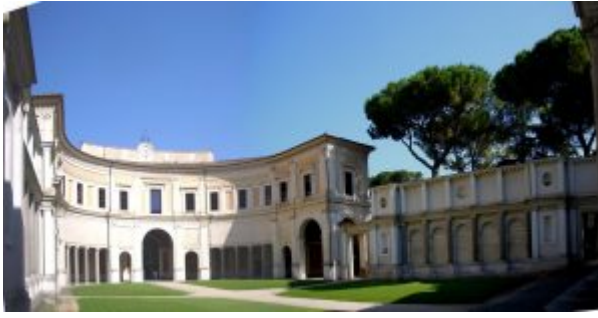
Виньола, первый двор виллы Джулия в Риме

Барокко (итал. barocco – странный, причудливый) основное стилевое направление в искусстве Европы и Америки конца XVI – середины XVIII веков. Барокко, связанное с дворянско-церковной культурой зрелого абсолютизма, тяготеющее к торжествующему «большому стилю», в то же время отразило антифеодалные устремления, прогрессивные представления о сложности, многообразии, изменчивости мира. Барокко свойственны контрастность, напряженность, динамичность образов, аффектация, стремление к величию и пышности, к совмещению реальности и иллюзии, к слиянию искусств (городские и дворцовые парковые ансамбли, опера, оратория). Для архитектуры барокко (Л. Бернини, Ф. Борромини в Италии, В. В. Растрелли в России) характерны пространственный размах, слитность, текучесть сложных, обычно криволинейных форм. Разнообразны национальные варианты барокко (например, «московское», «нарышкинское» барокко в России).