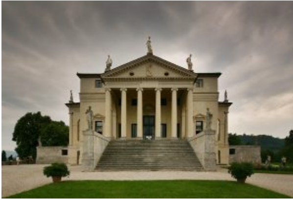
Андреа Палладио. Вилла Ротонда близ Виченцы

Классицизм (от лат. classicus – образцовый), стиль и направление в литературе и искусстве XVII – начала XIX веков, обратившиеся к античному наследию как к норме и идеальному образцу. Классицизм сложился в XVII веке во Франции, отразив подъем абсолютизма. В XVIII веке классицизм был связан с буржуазным Просвещением и выразил гражданские идеалы, бурж.-рев. устремления. Классицизм, основывавшийся на идеях философии рационализма, на представлениях о разумной закономерности мира, о прекрасной облагороженной природе, стремился к выражению большого общественного содержания, возвышенных героических и нравственных идеалов (главные темы – конфликт общественных и личных начал, долга и чувства), к строгой организованности логичных, ясных и гармоничных образов. Вместе с тем классицизму были присущи черты утопизма, идеализации и отвлеченности, нараставшие в периоды его кризиса. Архитектуре классицизма (Ж. Ардуэн-Мансар, Ж. А. Габриель, К. Н. Леду во Франции, К. Рен в Англии, В.И. Баженов, М.Ф. Казаков, а. Н. Воронихин, А.Д. Захаров, К.И. Росси в России) присущи четкость и геометризм форм, логичность планировки, сочетание стены с ордером и сдержанным декором. К середине XIX века классицизм переродился в безжизненный академизм.