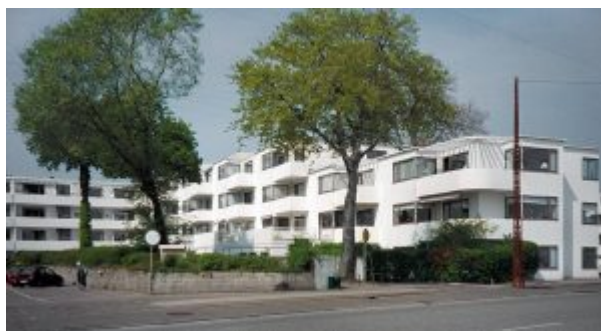
Bellavista Denmark Арне Якобсен (1934)

Аналоги неоклассицизма в зарубежной практике — американский ренессанс и колониальное возрождение в США (1876—1914).