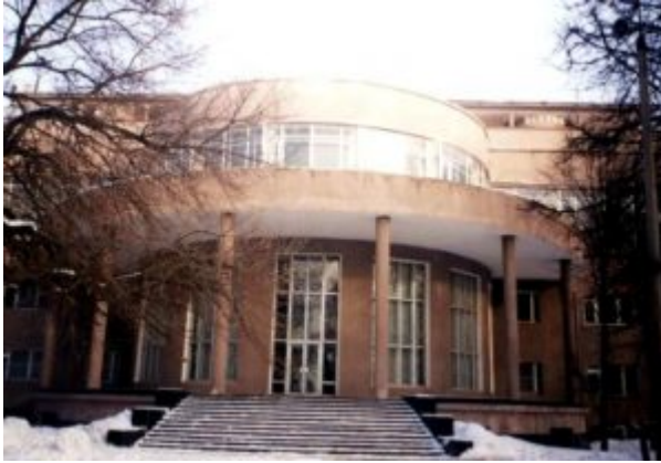
Дом Культуры ЗИЛ. Арх. братья Веснины

Как и ряд других стилей, архитектуру модерна отличает также стремление к созданию одновременно и эстетически красивых, и функциональных зданий. Большое внимание уделялось не только внешнему виду зданий, но и интерьеру, который тщательно прорабатывался. Все конструктивные элементы — лестницы, двери, столбы, балконы — художественно обрабатывались.