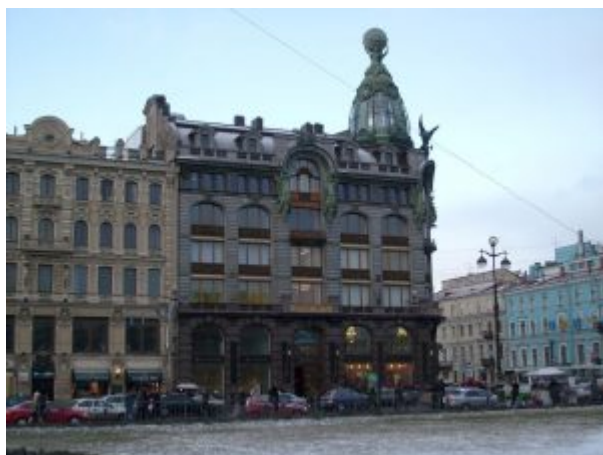
Дом компании «Зингер» (ныне — штаб-квартира компании Вконтакте) в Санкт-Петербурге.

Эклектика прошла два этапа в развитии — 1830-е—1860-е гг. и 1870-е—1890-е гг.; в России естественно разделение на «николаевский» и «александровский» этапы. За этим делением стоит не столько различие в политических режимах, сколько социальная эволюция общества России и Европы в целом, возникновение нового класса заказчиков и новых функций архитектуры.