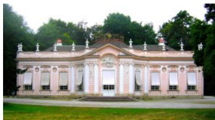
Французское рококо: Амалиенбург под Мюнхеном.

Барокко (итал. barocco – странный, причудливый) основное стилевое направление в искусстве Европы и Америки конца XVI – середины XVIII веков. Барокко, связанное с дворянско-церковной культурой зрелого абсолютизма, тяготеющее к торжествующему «большому стилю», в то же время отразило антифеодалные устремления, прогрессивные представления о сложности, многообразии, изменчивости мира. Барокко свойственны контрастность, напряженность, динамичность образов, аффектация, стремление к величию и пышности, к совмещению реальности и иллюзии, к слиянию искусств (городские и дворцовые парковые ансамбли, опера, оратория). Для архитектуры барокко (Л. Бернини, Ф. Борромини в Италии, В. В. Растрелли в России) характерны пространственный размах, слитность, текучесть сложных, обычно криволинейных форм. Разнообразны национальные варианты барокко (например, «московское», «нарышкинское» барокко в России).