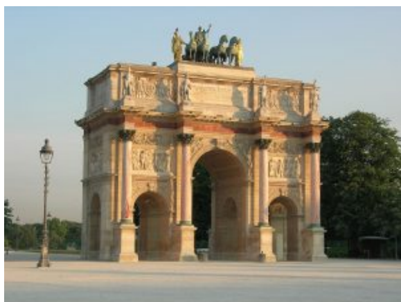
Арка Каррузель, Париж

формы иронии, гротеска, поэтику двоемирия. Интерес к национальному прошлому (нередко – его идеализация), традициям фольклора и культуре своего и других народов, стремление создать универсальную картину мира (прежде всего истории и литературы), идея синтеза искусств нашли выражение в идеологии и практике романтизма. Большинство национальных школ романтизма в изобразительном искусстве сложилось в борьбе с официальным академическим классицизмом. В России романтические мотивы характерны для творчества О.А. Кипренского, А.О. Орловского и других.