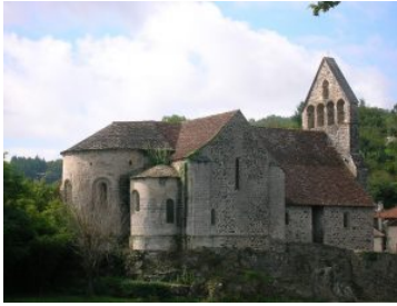
Капелла кающихся грешников. Больё-сюр-Дордонь.

Романский стиль. X- XII века (в некоторых странах XIII век) (с элементами римско-античной культуры). Средневековое западноевропейское искусство времени полного господства феодально-религиозной идеологии. Главная роль в романском стиле отводилась суровой, крепостного характера архитектуре: монастырские комплексы, церкви, замки располагались на возвышенных местах, господствуя над местностью. Церкви украшались росписями и рельефами, в условных, экспрессивных формах, выражавшими пугающее могущество божеств. Вместе с тем полусказочные сюжеты, изображения животных и растений восходили к народному творчеству. Высокого развития достигли обработка металла и дерева, эмаль, миниатюра. Для романской эпохи характерны благородство и строгая красота.