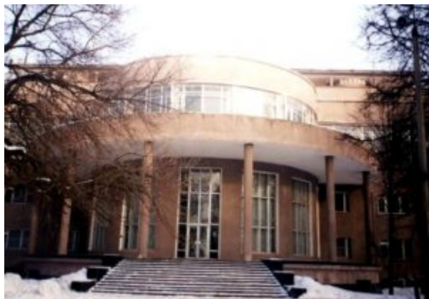
Дом Культуры ЗИЛ. Арх. братья Веснины

Как и ряд других стилей, архитектуру модерна отличает также стремление к созданию одновременно и эстетически красивых, и функциональных зданий. Большое внимание уделялось не только внешнему виду зданий, но и интерьеру, который тщательно прорабатывался. Все конструктивные элементы — лестницы, двери, столбы, балконы — художественно обрабатывались.