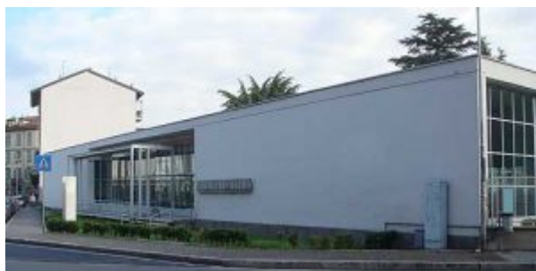
Комо — Приют Сант'Элиа. Джузеппе Терраньи

Конструктивисты видели своей задачей увеличение роли архитектуры в жизни, и способствовать этому должны были отрицание исторической преемственности, отказ от декоративных элементов классических стилей, использование функциональной схемы как основы пространственной композиции. Конструктивисты искали выразительность не в декоре, а в динамике простых конструкций, вертикалей и горизонталей строения, свободе плана здания.