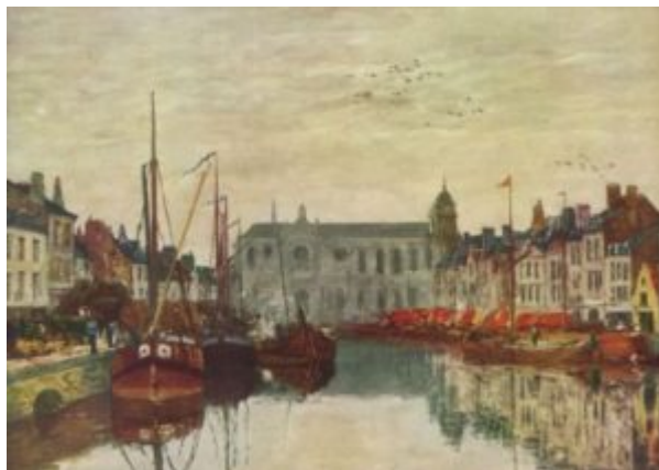
Буден, Эжен. Канал в Брюсселе. 1871

Поль Гоген также отказался от объективности импрессионизма. Вместе с Эмилем Бернаром он разрабатывает идеи нового направления — синтетизма, целью которого было объединить и воспроизвести все элементы опыта, как субъективные, так и объективные. Эти идеи переняли ученики Гогена, группа Наби (от ивр. пророк), в которую входили Поль Серюзье, Морис Дени, Пьер Боннар, Эдуард Вюйар и другие художники. Создание зримого образа движений души объединяет поиски Наби с творчеством символистов: Пюви де Шаванна, Гюстава Моро, Одилона Редона.