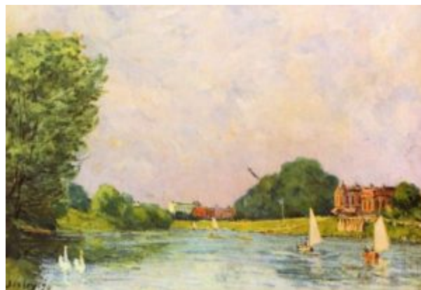
Сислей, Альфред. Темза близ Хэмптон-Корта. 1874

Доминирующим жанром импрессионистической живописи становится пейзаж, и некоторые художники этого направления, например, Альфред Сислей , пишут почти исключительно пейзажи. Задача художника при этом заключается прежде всего в точной передаче света, а не в изображении той или иной местности. Поэтому в живописи импрессионистов появляются повторяющиеся мотивы. Клод Моне первым начал писать серии, в которых один и тот же вид изображен в разном освещении, будь то руанский собор, стог сена или пруд с кувшинками в саду художника в Живерни.