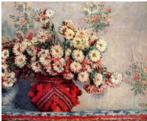
Моне, Клод. Натюрморт с хризантемами. 1878

Импрессионисты обращаются также и к сценам городской жизни: мир парижских кафе, оперы, театра, кабаре Мулен Руж и Мулен де ла Галетт. Эдгар Дега и его младший современник, Анри де Тулуз-Лотрек, создают картины преходящего мира, в которых ощущается непосредственное влияние японского искусства.