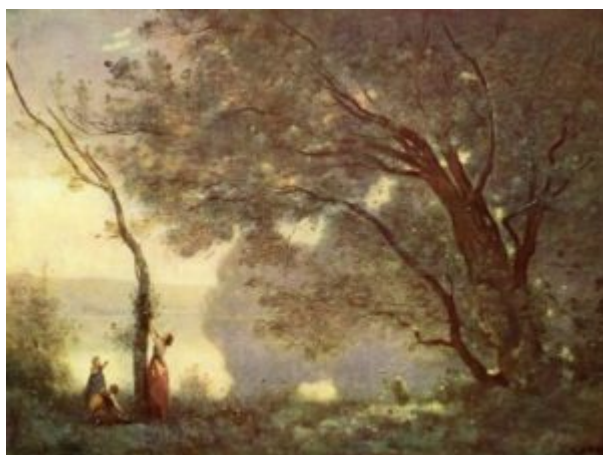
Коро, Жан-Батист-Камиль. Воспоминание о Мортefonтене. 1864

Еще предшествующий импрессионистам вариант живописного романтизма — барбизонцы ( К. Коро и др.) — стремились уловить тончайшие настроения погоды, атмосферы. Большое внимание они уделяли написанию этюдов на природе, а Добиньи прямо «на пленэре» писал картины. Для импрессионистов такой принцип работы стал правилом: основным «героем» их картин был воздух (как световая среда).