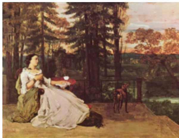
Курбе, Гюстав. Дама на террасе. 1858

иррационализма и французского позитивизма. Если первый в образах действительности пытается усмотреть признаки потустороннего мира (который на самом деле является отражением наработанных смыслов данной культуры), то второй сомневается в самой возможности увидеть что-либо, кроме собственных ощущений. С научной точностью пытаются воссоздать свои чувственные впечатления импрессионисты. Аналитический подход к собственной художественной деятельности позволил им совершить ряд открытий и сформулировать несколько принципов.