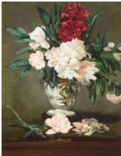
Мане, Эдуард. Натюрморт. Ваза с пионами. 1864-1865

Фактически, провозглашая одну из программ, импрессионисты открыли концептуальное искусство — искусство современное, где главным оказывается принцип видения, идея, которая и представляет собой основную ценность. В полной мере это реализовали постимпрессионисты (Сезанн, Гоген, Ван Гог, Дега, Тулуз-Лотрек).