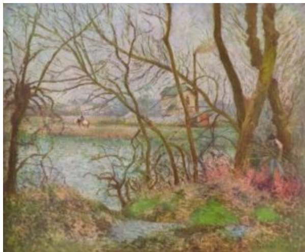
Писсарро, Камиль. Дровосек. 1878

В русской живописи импрессионизм свойствен начальному периоду многих художников. Выдающимися произведениями в этом стиле были картины В. Серова «Девочка с персиками» (1887 г.), «Девушка, освещенная солнцем» (1888 г.). Всецело в духе импрессионизма творчество К. Коровина и И. Грабаря.