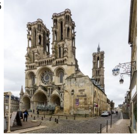
Раннеготический собор в Лане

стрельчатый свод центрального нефа, высота которого 35 м, стрельчатые окна, аркбутаны. Но от тяжеловесной романской архитектуры остались массивная гладь стен, приземистые столбы центрального нефа, преобладание горизонтальных членений, грузные башни, сдержанный скульптурный декор. Раннеготический собор в Лане (1174—1226), трех-нефный с трехнефным трансептом, имеет также романские черты: полуциркулярные арки, невысокие окна, скупость декора, суровость стен, массивность опор. Особенностью Ланского собора является украшение верха башен фигурами 16 быков; существует легенда о том, что при строительстве собора, когда силы строителей иссякали, появился прекрасный белый бык, который помог завершить храм.