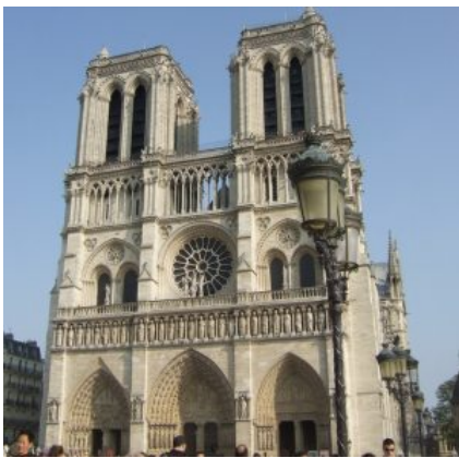
Собор Парижской Богоматери

С конца XII в. Франция становится центром европейской образованности. Парижский университет скоро занял одно из ведущих мест в научной жизни Европы. В области архитектуры и изобразительных искусств Франции также принадлежит главная роль. В XIII в. в Париже насчитывается 300 цехов. Главным заказчиком произведений искусства становятся теперь не церковь, а города, гильдии купцов, цеховые корпорации и король. Основным типом сооружения становится в свою очередь не монастырская церковь, а городской собор.