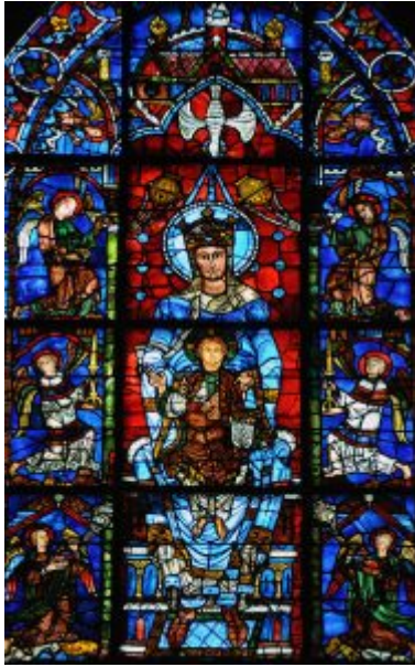
Фрагмент витража «Богородица из красивого стекла», Шартрский собор

Готика — это и расцвет монументальной живописи, витража. Особенно славилась на всю Францию Шартрская мастерская. В Шартрском соборе в XIII в. витражи занимали площадь в 2600 кв. м. Самым старым считался витраж хора церкви Сен Дени, погибшей в конце XVIII в. Сюжеты витражной живописи те же, что и скульптурного декора. Главные особенности старого витража — это интенсивная цветовая гамма основных цветов (красного, синего, желтого), куски стекла небольшого размера, свинцовая обводка исполняет роль контурного рисунка. XIII век во Франции справедливо считался золотым веком витража.