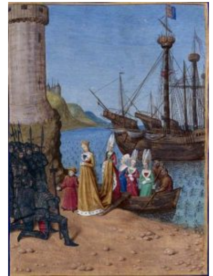
Возвращение Изабеллы, королевы Англии, на родину — во Францию. Миниатюра «Хроник» работы Жана Фуке

В XIII—XIV вв. продолжает развиваться книжная миниатюра. Среди различных школ особенно знаменита Парижская, но в эти века можно