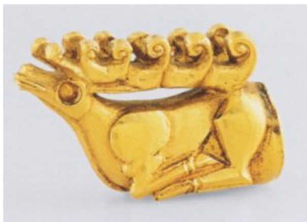
Ил. 102. Золотая фигурка оленя из Келермесского кургана

102. Золотая фигурка оленя из Келермесского кургана