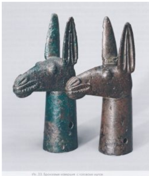
Ил. 33. Бронзовые напершия с головами мулов

Бронзовые напершия с головами мулов (ил. 98).