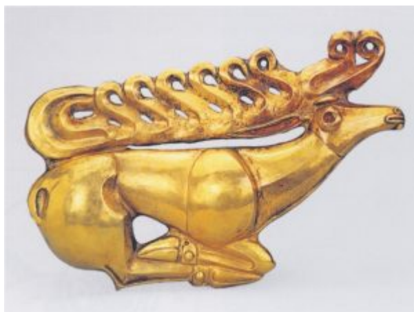
Ил. 101. Шедевр скифского звериного стиля архаической эпохи – золотой олень из Костромского кургана в Прикубанье