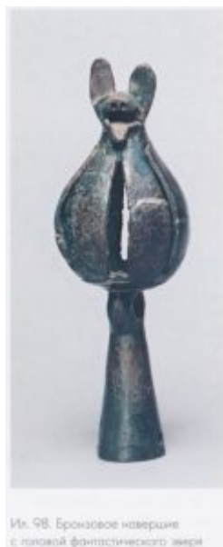
Ил. 98. Бронзовое навершие с головой фантастического зверя

Некоторые исследователи полагают, что скифское искусство сложилось на основе ассирийской, урартской и североиранской изобразительных традиций в период пребывания евразийских кочевников на Ближнем Востоке. Однако эту точку зрения опровергают памятники звериного стиля, созданные на территории Евразии в 8 — начале 7 века до н.э., т.е. до начала скифской экспансии в Закавказье и Переднюю Азию. Поэтому не приходится сомневаться в том, что скифы появились в этом регионе с уже развитой художественной культурой, которая, однако, окончательно оформилась и обогатилась под воздействием переднеазиатского искусства.