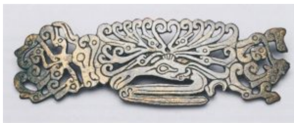
Ил. 103. Бронзовый уздечный налобник с гравированными изображениями: протомы оленя (в центре) и головы оленя (слева) с рогами в виде тлющих голов. Случайная находка в Прикубанье. 4 в. до н.э.

Ил. 101. Ил. 102. Ил. 103. Ил. 104. Ил. 105. (72/73)