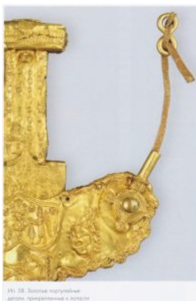
Золотые портупейные детали

природу, верно передать сущность каждого зверя. Бросается в глаза полное пренебрежение к мелким анатомическим подробностям, предельно упрощённая моделировка форм тела крупными, резкими плоскостями — приём, по-видимому, зародившийся в технике резьбы по дереву и кости, который был затем перенесён на изделия из металлов. Мастера сознательно подчёркивали и даже преувеличивали наиболее типичные черты, свойственные тому или иному виду животных. Акцент делался обычно на одном-двух отличительных признаках.