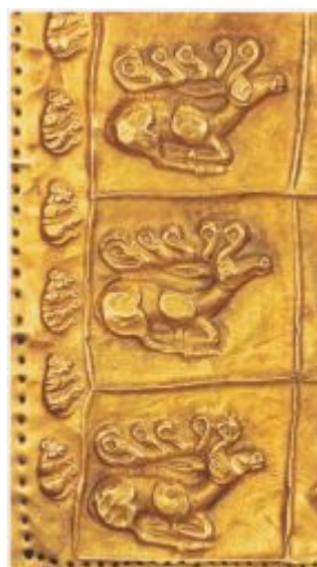
Ил. 96. Детали золотой обкладки горшка с изображением характерных скифских мотивов — лекащие олени и хищные пантеры

Большинство исследователей склоняется к мысли о связи зооморфных образов с божествами скифского религиозного пантеона, олицетворявшими, судя по данным Геродота, космические и природные явления. Как известно, у египтян, шумеров, греков и других народов Древнего мира почитаемых божеств символизировали дикие звери. Те же воззрения были свойственны и родственным скифам индоиранским племенам. Причём, по их представлениям, одно и то же животное могло замещать разных богов и, наоборот, каждое божество обладало способностью перевоплощаться в разных зверей. Так, к примеру, в «Ведах» — сборниках индоарийских религиозных гимнов — солнечный бог Сурья принимает облик то парящей в небе птицы, то коня. Особенно многочисленным метаморфозам был подвержен древнеиранский бог грома и победы Веретрагна, с лёгкостью превращавшийся из белого коня, быка или барана в козла, кабана, верблюда и хищную птицу.