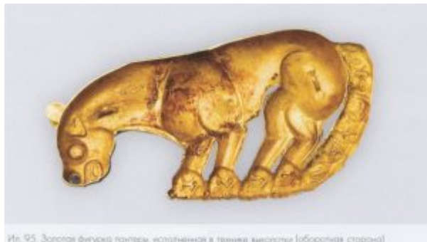
Золотая фигурка пантеры, выколотка

Однако возникает вопрос, чем объясняется строго ограниченный набор мотивов скифского искусства? Почему в нём наряду с животными исключительно диких видов фигурируют и странные фантастические существа? Но раскрыть суть зооморфных знаков-символов не так-то просто. Причина кроется и в недостатке сведений о скифском фольклоре, и в специфике скифского художественного метода, творцы которого воспроизводили, как правило, один персонаж, а не сцены повествовательного характера.