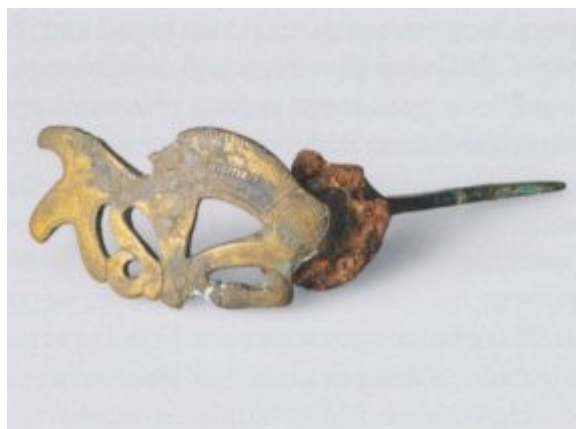
Ил. 105. Бронзовая пластина псаля с изображением протомы оленя с рогами в виде птичьих голов. Елизаветинский курган в Прикубанье. 4 в. до н. э.

получают распространение скульптурные надгробия, создаются памятники архитектуры, настенные фрески, в которых наряду с явственно ощутимым влиянием греческого искусства прослеживаются и элементы древнейшей скифской традиции.