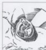
Ил. 99, 100. Бронзовое зеркало с ручкой в виде свернувшегося хищника кошачьей породы в центре