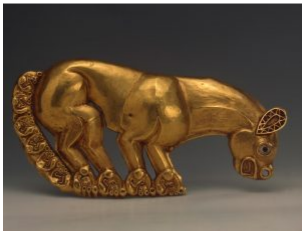
Бляха в виде фигурки кошачьего хищника (пантеры)

Всемирной известностью пользуется эрмитажное собрание скифских древностей VII-IV веков до н. э., основу которого составили находки, полученные в результате раскопок курганов Прикубанья, Поднепровья, Крыма, проводившихся с XVIII по XX век.