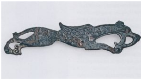
Ил. 104. Бронзовый уздечный налобник – фигура стремительно бегущего крылатого львиноголового грифона. Елизаветинский курган в Прикубанье. 4 в. до н. э.

Греческое искусство, так же как в своё время и переднеазиатское, несомненно, обогатило художественное творчество скифов новыми сюжетами и композиционными решениями, но оно не изменило его природы, его основных критериев.