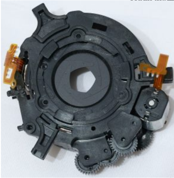
Электромагнитный исполнительный механизм прыгающей диафрагмы объектива Canon EF

Прыгающая диафрагма. Нажимная диафрагма. Моргающая Наиболее сложная разновидность привода диафрагмы. | 6