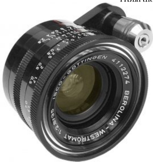
Объектив с механизмом нажимной диафрагмы на оправе

Диафрагма. Диафрагма с кольцом предварительной установки. Прыгающая диафрагма. Нажимная диафрагма. Моргающая диафрагма, закрываемая до рабочего значения диафрагмы вручную за счёт дополнительного усилия на спусковой кнопке или кнопке оправы объектива, кинематически совмещённой со спусковой. Предшествовала изобретению прыгающей диафрагмы и впервые использована в камерах «Ехакта», а затем «Торсон» и «Miranda», в сочетании с расположением спусковой кнопки на передней стенке корпуса. В иностранных источниках называется «автоматическая нажимная диафрагма» (англ. Automatic Pressure Diaphragm). Ранние образцы основаны на оригинальной конструкции оправы объектива со специальной кнопкой закрывания диафрагмы.