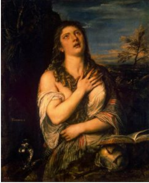
Тициан. «Кающаяся Мария Магдалина» (1560-е)