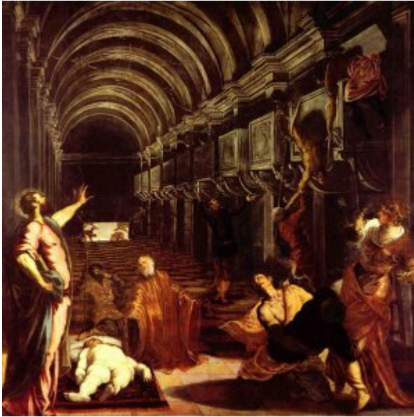
Тинторетто. Обретение мощей апостола Марка (1548)

горизонтальном, но и в вертикальном направлении, так что темному пятну в левом верхнем углу композиции соответствовало светлое пятно в правом нижнем углу. Так впервые в европейскую живопись стал проникать принцип диссонанса, разрешающегося в конце концов в гармонию. Самым излюбленным приемом красочной композиции в эпоху барокко становится так называемая овальная схема, согласно которой композиция картины составляется как бы из концентрических колец овальной формы, попеременно то светлых, то темных, то теплых, то холодных.