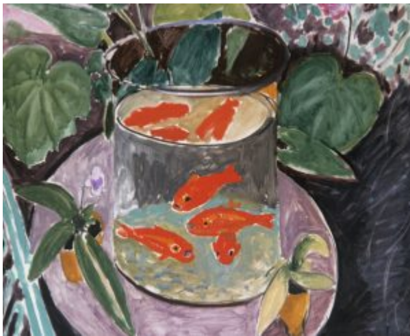
«Красные рыбы» Анри Матисс

Живописцы XIX века, особенно импрессионисты, научились воссоздавать солнечное сияние, выделяя светлое на светлом. Они перешли к применению чистых красок, используя эффекты оптического смешения цветов, больше внимания уделяя цветовым контрастам.