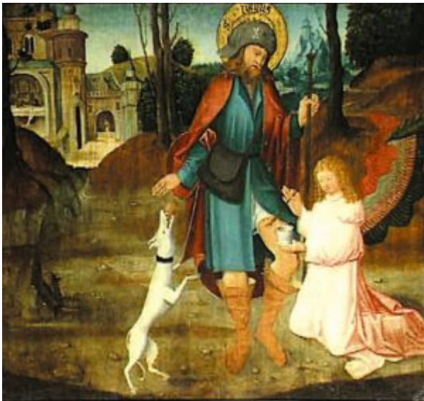
Исцеление ран святого Рох

В XV веке краски на полотнах итальянских, французских, немецких художников существовали как бы независимо друг от друга.