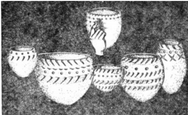
Глиняная посуда, неолит, 7-3 тысячелетие до н. э.

до этого пользовались в хозяйстве посудой из коры и дерева и корзинами из прутьев. Но их, естественно, применяли только для хранения припасов пищи. Появление глиняной посуды было явлением качественно новым этапом.