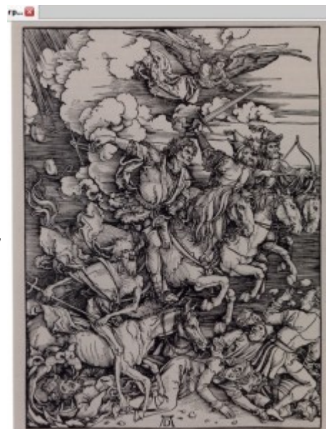
А.Дюрер. Четыре апокалипсических всадника, 1498. Из серии «Апокалипсис». Ксилография

До конца XVIII века существовала лишь обрезная, или продольная, ксилография : плоская отполированная доска (дерево вишни, груши, яблони), непременно продольного распила, вдоль волокон дерева, загрунтовывается, поверх грунта пером наносится рисунок, затем линии с обеих сторон отрезаются острыми ножичками, а дерево между линиями выбирается особым долотом на глубину 2-5 мм. При печати краска накладывается (прежде тампонами, впоследствии — валиком) на выпуклую часть доски, на нее кладется лист бумаги и равномерно придавливается — прессом вручную, таким способом изображение с доски переходит на бумагу. При обрезной гравюре композиция оказывается комбинацией черных линий и контрастных пятен, которые максимально контрастируют с белой бумагой. Эта звонкость сопоставления черного и белого уже заранее определяет большую декоративность обрезной гравюры, а контрасты черных и белых плоскостей, особенно при работе белым по черному, создают эмоциональное напряжение.