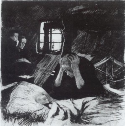
Кете Кольвиц. Нужда. Мягкий лак

Поверхность металлической пластины при помощи тампона или валика покрывают специальным кислотоупорным лаком, в котором содержится баранье или свиное сало, придающее ему мягкость и липкость. Загрунтованную таким образом доску покрывают листом бумаги, желательнее с крупной фактурой и не слишком толстой. По бумаге рисуют карандашом. При нажиме карандаша лак прилипает к обратной стороне бумаги. Затем бумага снимается вместе с приставшими кусочками лака, обнажая поверхность доски.