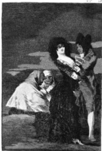
Solo para quiet.

Ф. Гойя. Один другого стоит (Каприччос). 1797—1799. офорт. акватинта, сухая игла