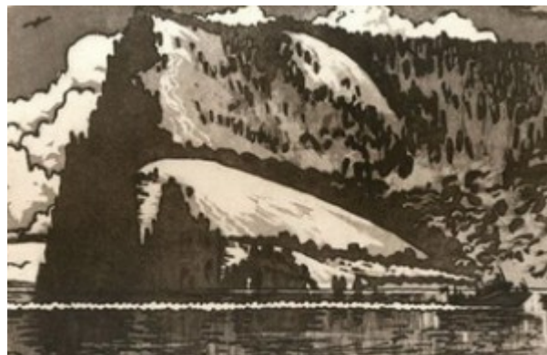
А. Зуев. Жигули, Молодецкий курган. Резерваж

Оттиск, полученный с формы резерваж-кисть , напоминает рисунок кистью, только мазки на нем равномерного тона, без растяжек, с ровными ясно очерченными краями. Если рисование кистью осуществлялось на слабо обезжиренной доске, то края мазков приобретают неровную брызгообразную форму. Скатанная краска на границах мазков дает характерный силуэт, который некоторые художники используют как своеобразную графическую фактуру. Этот прием также