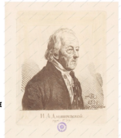
О. Кипренский, портрет И.А.Дмитриевского. Мягкий лак, 1814

Эта разновидность офорта дает возможность, как и меццотинто, передавать тоновое изображение. Только зернение доски здесь получается не механически, а при помощи травления. Для этого поверхность металлической пластины покрывают тонким слоем очень мелкого порошка канифоли или асфальта. Запыленную таким образом доску подогревают, частицы порошка при этом расплавляются и прилипают к металлу. Если такую пластину протравить, то мельчайшие промежутки между пылинками канифоли углубятся, и мы получим равномерно зерненую поверхность. При печати такая форма даст ровный тон, интенсивность которого будет зависеть от глубины травления.