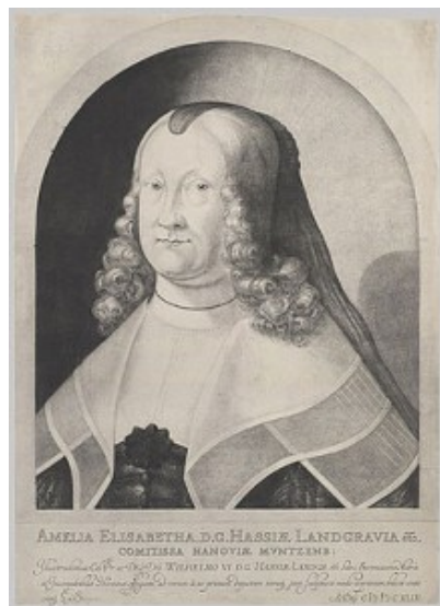
Portrait of Amelie Elisabeth von Hessen, the first known mezzotint, by Ludwig von Siegen, 1642

Изобретателем данной техники является работавший в Касселе (Германия) голландский художник-самоучка Людвиг фон Зиген.