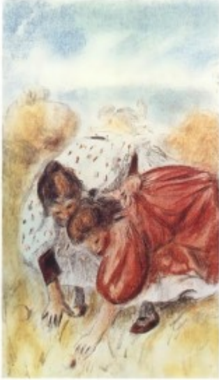
О.Ренуар. Дети. Цветная литография

мастерские оружейников), но гравюра в истинном смысле слова, как отпечаток на бумаге изображения, вырезанного на специальной доске, появляется только в это время.