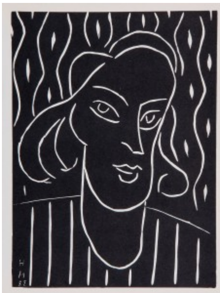
Henri Matisse Linocuts