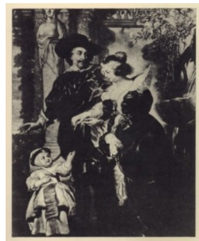
Неизвестный гравер. Копия с картины Рубенса «Семья Рубенсов». Акватинта

Ж.-Ф. Жанине Ш.-М. Декурти, А. Ф. Жирар, Франциско Гойя К. Кунц, Ф. Флейшман Э. Мане, Т.-А. Стейнлен, Ф. Ропс, М. Клинггер