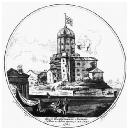
Н. А. Львов. Вид Выборгского замка. Гравюра лависом. 1783

Лавис. Изобретён французским художником XVIII в. Ж. Б. Лепренсом, позже употреблялся как средство тонирования в других разновидностях углубленной гравюры с травлением.. Гравюры в технике лависа напоминают рисунок кистью с размывкой. Границы тонового пятна резко очерчены.