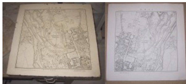
Фотография литографского камня и литографии — карты Мюнхена

Техника литографии изобретена в 1796 году в Германии А.Зенефельдером в Богемии, и это была первая принципиально новая техника печати после изобретения гравюры в XV веке. В литографии используется способность некоторых пород известняка не принимать на себя краску после протравливания слабой кислотой.