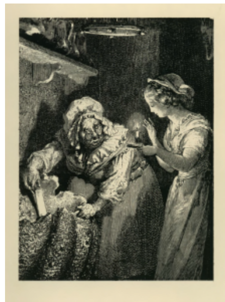
Г. Доре. Иллюстрация к сказке Ш.Перро «Золушка». 1888. Торцовая гравюра на дереве

Владимир Андреевич Фаворский (1886—1964) — русский советский график