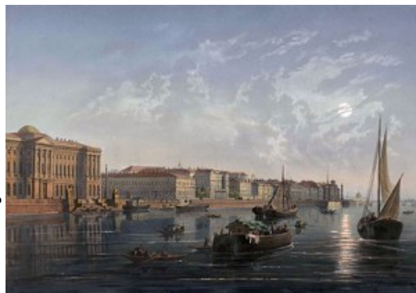
Университетская набережная, XIX век, литография Мюллера по рисунку И. Шарлеманя