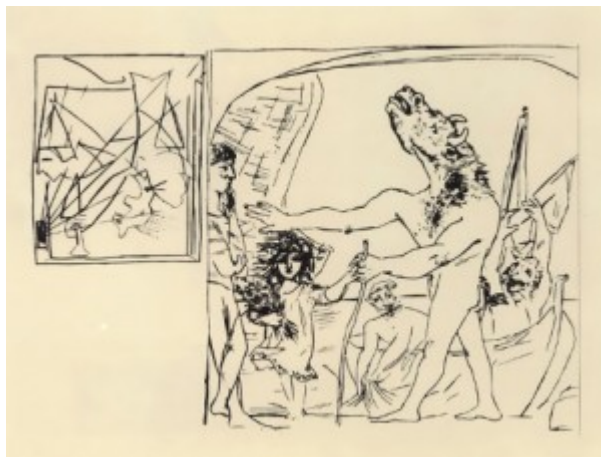
П.Пикассо. Слепой минотавр. Офорт, сухая игла

Доска покрывается кислотоупорным лаком, рисунок иглой процарапывается в лаке, обнажая поверхность металла. Затем пластина помещается в кислоту, которая вытравливает металл в открытых от лака областях. После травления остальной лак снимается с пластины. Перед печатью на пластину наносится краска, а затем гладкая поверхность печатной формы очищается от неё, в результате чего краска задерживается только в протравленных углублениях. При печати эта краска из углублённых печатающих элементов переносится на бумагу. Таким образом, офорт является разновидностью глубокой печати. Офорт дает около 500 оттисков.