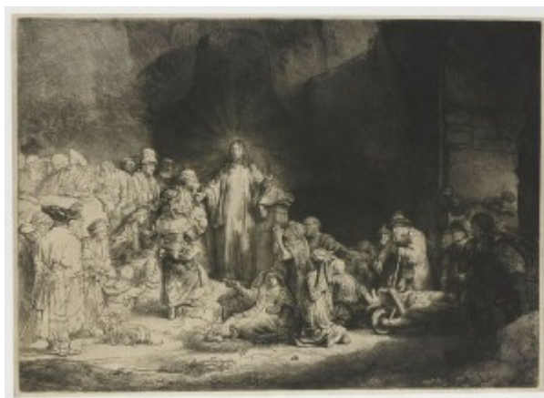
Рембрандт. Проповедь Христа. Офорт, сухая игла, резец, 1648 г.

Офорт с технологической точки зрения полярно противоположен резцу. Офортная игла процарапывает тонкую пленку лака с чрезвычайной легкостью, что само уже провоцирует мастера к максимальной подвижности и свободе линии. Офортист с одинаковой непринужденностью может работать и длинным текучим штрихом, и короткими ударами иглы, в его распоряжении есть повторное травление, создающее широкую шкалу тональности, он всегда может в процессе работы внести изменения и исправления в рисунок. Поэтому-то в офорте проявляется интерес к световоздушной среде, которая передается диапазоном тональности, и к подвижности характеристики, что связано с некоторой неопределенностью, беглостью пластики. Образ,