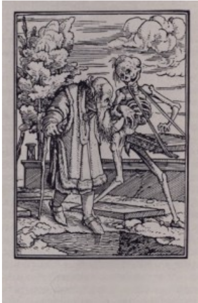
Г. Гольбейн Младший. Старик и смерть. 1526. Из серии Пляска смерти

Поллайоло и А. Мантенья применяли параллельную и перекрёстную штриховку, добиваясь объёмности, скульптурности форм, героической монументальности образов. А. Дюрер завершил искания мастеров Возрождения, сочетая характерную для немецкую гравюры виртуозную тонкость штриха с присущей итальянцам пластической активностью образов, наполненных глубоким философским смыслом; драматизм и лирика, героические и жанровые мотивы появились и в ксилографиях по его рисункам. Г. послужила оружием острой социальной борьбы в Германии («летучие листки») и Нидерландах (гравюры круга П. Брейгеля Старшего).