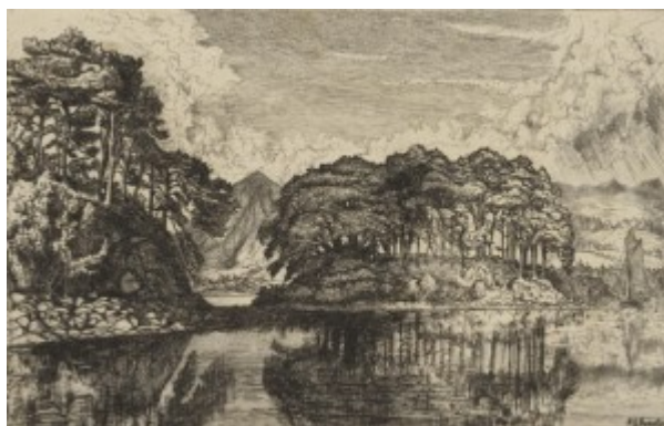
Черные острова Лох-Эве, Хамертон, 1875

Отличительной особенностью оттисков с гравированной таким образом формы является «мягкость» штриха: используемые гравером иглы оставляют на металле углублённые борозды с поднятыми заусенцами — барбами. Штрихи также имеют тонкое начало и окончание, поскольку процарапаны острой иглой. Эти барбы задерживают краску, когда ее наносят на форму, чем создается особый эффект на оттиске.