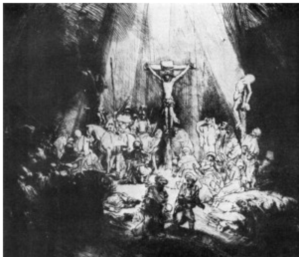
Три креста, Рембрандт, 1653

Особой популярностью техника сухой иглы пользовалась в XVII веке. Часто эта техника применялась в сочетании с офортом для достижения богатства тональных оттенков.