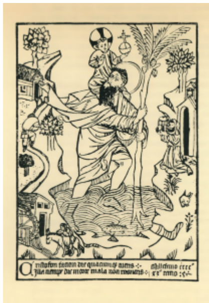
Неизвестный немецкий гравер Св. Христофор с младенцем. Одна из первых гравюр. Ок. 1476. Обрезная гравюра на дереве

Ксилография. Самая древняя техника гравюры. На Востоке наиболее ранний из оттисков на бумаге датирован 868 годом. В Европе появляется на рубеже XIV- XV веков, первая датированная ксилография относится к 1418 году.