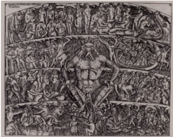
Баччо Бальдини. Ад. 1477