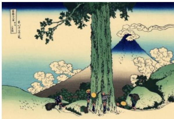
Перевал Мисимагоэ в провинции Косю. Кацусика Хокусай, 1830

образом в XVI веке. Каждая доска отличается от другой не только цветом, но и оттенком тона, причем чаще всего на каждой доске вырезается лишь часть композиции: целиком последняя появляется на оттиске лишь в результате печатания со всех досок. Одним из первых мастеров в технике кьяроскуро (светотень) был итальянский гравер Уго ди Карпи (ок. 1480-1532), печатавший свои работы с трех досок разного цвета. XVI столетие дало нам самых лучших мастеров кьяроскуро, однако в XVII веке эта техника в Италии начала угасать, и практически выродилась к XVIII столетию.