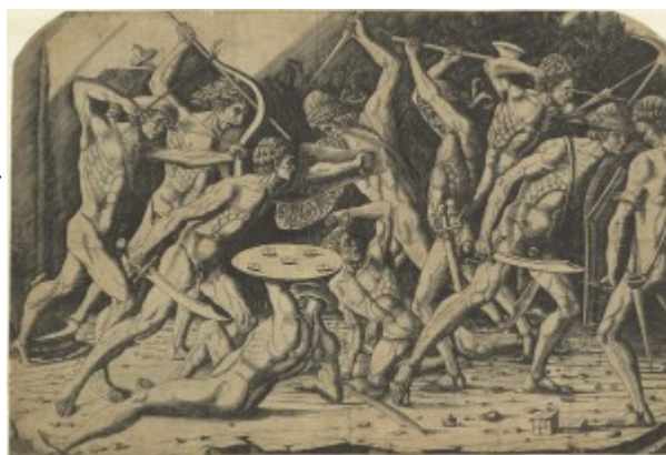
Битва обнаженных мужчин. Поллайоло, Антонио дель. Резцовая гравюра на меди

наиболее значительны Андреа Мантенья и Антонио дель Поллайоло. В той же Италии в XVI веке возникло направление, предопределившее важную веху в развитии европейской гравюры — это было репродуцирование произведений живописи. Возникновение репродукционной гравюры связано с именем Маркантонио Раймонди, который, работая до конца первой трети XVI столетия, создал посредством резца несколько сотен воспроизведений с работ Дюрера, Рафаэля, Джулио Романо и других. В XVII веке репродукционная гравюра была чрезвычайно распространена во многих странах — во Фландрии, где было воспроизведено множество полотен, особенно Рубенса. А во Франции в это время Клод Меллан, Жерар Эделинк, Робер Нантейль и другие способствовали расцвету искусства репродукционного классического гравированного портрета.