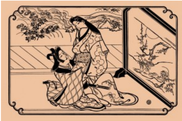
Моронобу В тени ширмы. 1680-е годы

Роулэндсона; лубки времени Великой французской революции). В России в 1-й половине 18 в. резцом гравировались патриотические аллегии, батальные сцены, портреты, городские виды (А. Ф. Зубов, И. А. Соколов, М. И. Махаев); во 2-й половине 18 — начале 19 вв. выдвинулись мастера портретной (Е. П. Чемесов, Н. И. Уткин), пейзажной и книжной (С. Ф. Галактионов, А. Г. Ухтомский, К. В. и И. В. Ческин) резцовой гравюрой, пунктира (Г. И. Скородумов), меццо-тинто (И. А. Селиванов), лависа (Н. А. Львов, А. Н. Оленин); к офорту обращались архитекторы (В. И. Баженов, М. Ф. Казаков, Ж. Тома де Томон), скульпторы и живописцы (М. И. Козловский, О. А. Кипренский), первые русские карикатуристы (А. Г. Венецианов, И. И. Терещенков, И. А. Иванов).