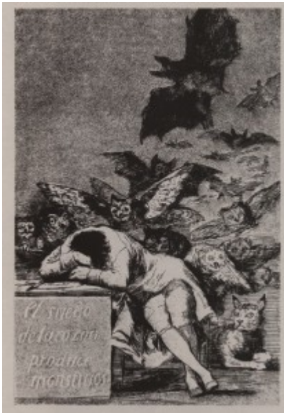
Ф.Гойя Сон разума рождает чудовищ. Из серии Капричос. 1797—1799

композицией, неожиданными ракурсами, смелой кадрировкой, с тонкой игрой плавных тончайших линий, мягких оттенков цвета и чёрных пятен, и Тёсюсай Сяраку, чьи гротескно резкие, экспрессивные и драматичные портреты актёров отличаются напряжённой контрастностью ритма и цвета, воплощением характера-символа. В 1-й половине 19 в. ведущую роль играли мастера пейзажной гравюры — Кацусика Хокусай, выразивший с необычайной свободой воображения сложность, изменчивость, неисчерпаемость природы, единство мира в большом и малом, и Андо Хиросиге, стремившийся точно запечатлеть красоту своей страны.