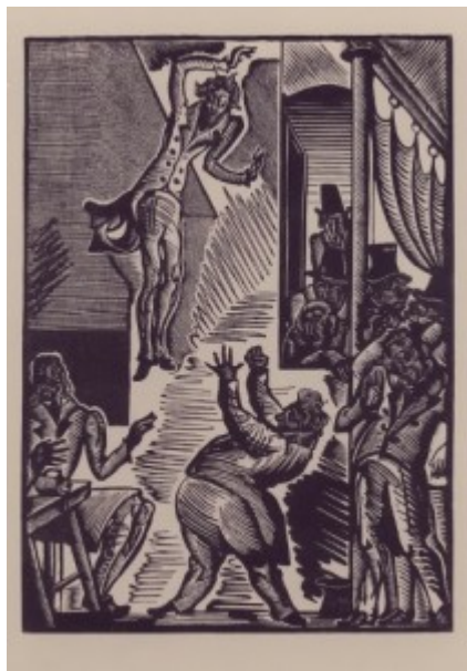
Л.Кравченко Иллюстрация к «Повелителю блох» Э.-Т.- А.Гофмана. 1922