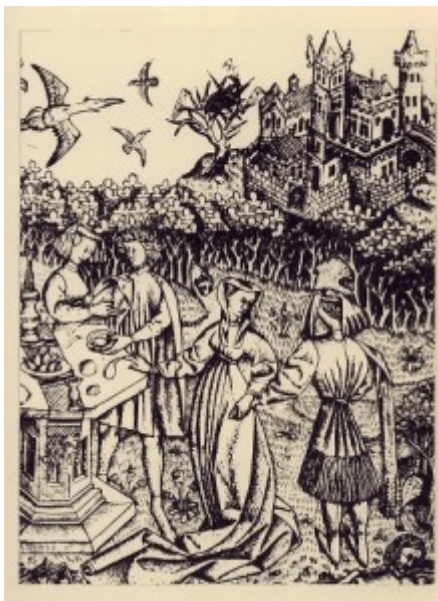
Неизвестный нидерландский гравер.

Резцовая гравюра. Появилась в первой четверти XV века. Первая датированная гравюра резцом относится к 1446 году. Рисунок врезается в металлическую доску стальным резцом квадратного сечения с ромбовидным срезом. Этот способ позволяет работать только комбинациями чистых линий. Гравюра резцом дает до 1000 оттисков.