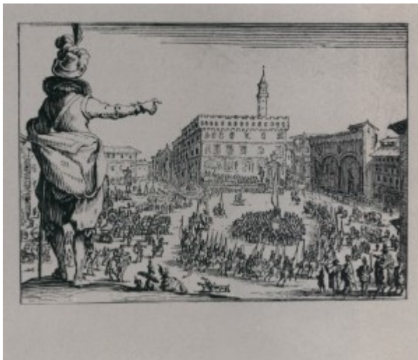
Ж.Калло Праздник на площади Синьории во Флоренции Из серии Каприччи. 1617

Общественный интерес к гравюре с её тиражностью появился в Европе в начале эпохи Возрождения — с ростом самосознания личности, с расширившейся потребностью в распространении и индивидуальном восприятии идей. Тогда же определилось тяготение гравюр к обобщенности и символичности художественного языка. Первые европейской ксилографии религиозного содержания, нередко раскрашенные от руки, появились на рубеже 14—15 вв. в Эльзасе, Баварии, Чехии, Австрии («Св. Христофор», датирован 1423); затем в этой технике исполнялись сатирические и аллегорические листы, азбуки, календари. Около 1430 возникли «блочные»