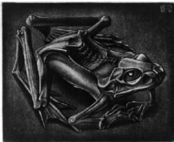
Мумифицированная лягушка. Эшер. Меццо-тинто, 1946

Рисунок на подготовленной таким образом доске выглаживается и отшлифовывается «гладилкой», причем чем сильнее выглаживается доска, тем слабее пристаёт к ней краска, и в оттиске эти места оказываются более светлыми.