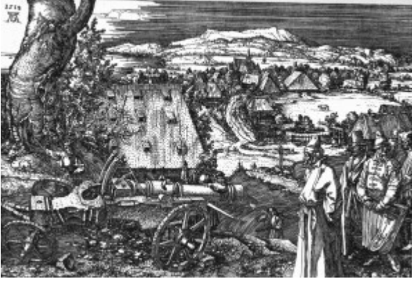
Альбрехт Дюрер. Пейзаж с пушкой. Офорт на меди, 1518

характерный для офорта, — всегда в становлении, в процессе. Он может быть физически не закончен, но динамичен, психологически глубок. И эта технологическая разница резца и офорта определяет и различие типичных для них жанров, и совсем иные сферы применения. Для резцовой гравюры характерны сюжетная композиция или репрезентативный портрет. Для офорта — пейзаж, психологическая сцена, интимный портрет, мгновенный набросок. Если резец внутренне близок к скульптурному рельефу, то эстетика офорта сродни рисунку.