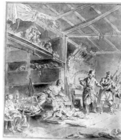
Жан-Батист Лепренс. Гравюра Изба.

Лавис может использоваться как дополнение к другим офортным техникам. Существует много разновидностей этой техники, которые подчас держатся в секрете их авторами, но суть их одна — непосредственное воздействие травящего раствора на поверхность будущей печатной формы и использование мазка кисти при создании изображения. Тиражность лависа очень мала, всего 20-30 экземпляров.